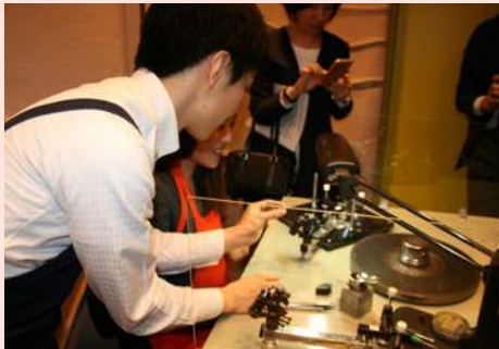
発表会後に行われたダイヤモンド研磨体験の様子

近年、ダイヤモンドのカットは一般的なブリリアントカットだけでなく、各社がさまざまなポイントをつけてアピールするようになりました。ケイ・ウノではダイヤモンド自体をよりオーダーメイド感を強くしたものをつくっていきたく、これまで発表したオリジナルカット以外にさらに新たなカットを開発しています。ケイ・ウノは、お客様にさらなる感動と喜びを贈り続けるために、国内にいる約150名のクラフトマン達と共にものづくりをより進化させ、多くの方にジュエリーを楽しんでいただければと考えています。