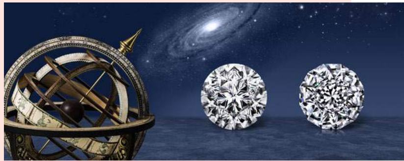
「テラ・ムンドゥス」(右)と「クララステラ」(左)。共に星や宇宙がテーマ

この2つのデザインは、いずれも星や宇宙がテーマとなっているのですが、実は全くの偶然だったのだそう。