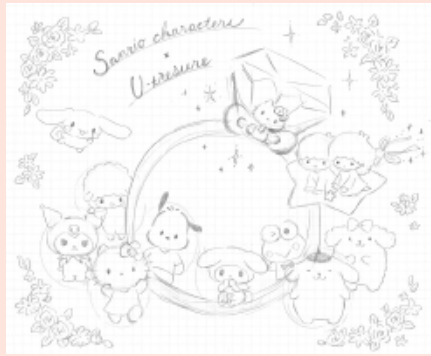
最終決定したオリジナルのキービジュアル(左)。右は貴重な試作段階のデザイン

げは大人っぽくしました。 少しわかりにくいかもしれませんが、背景のモチーフの中にも小さくキャラクターをあしらっています。ぜひじっくりご覧ください」 オリジナルのキービジュアルは商品の販促物や納品ケースなどにも使用する予定です。