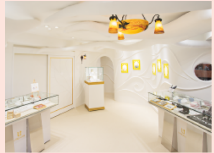
ユートレジャーロゴと新宿店内部。店内には工房があり、クラフトマンが常駐