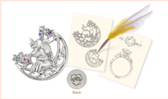
「ユニコーン」をデザインしたオーダーメイドのブローチ