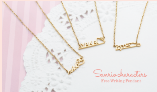
お守りやプレゼントにぴったりのネームネックレス